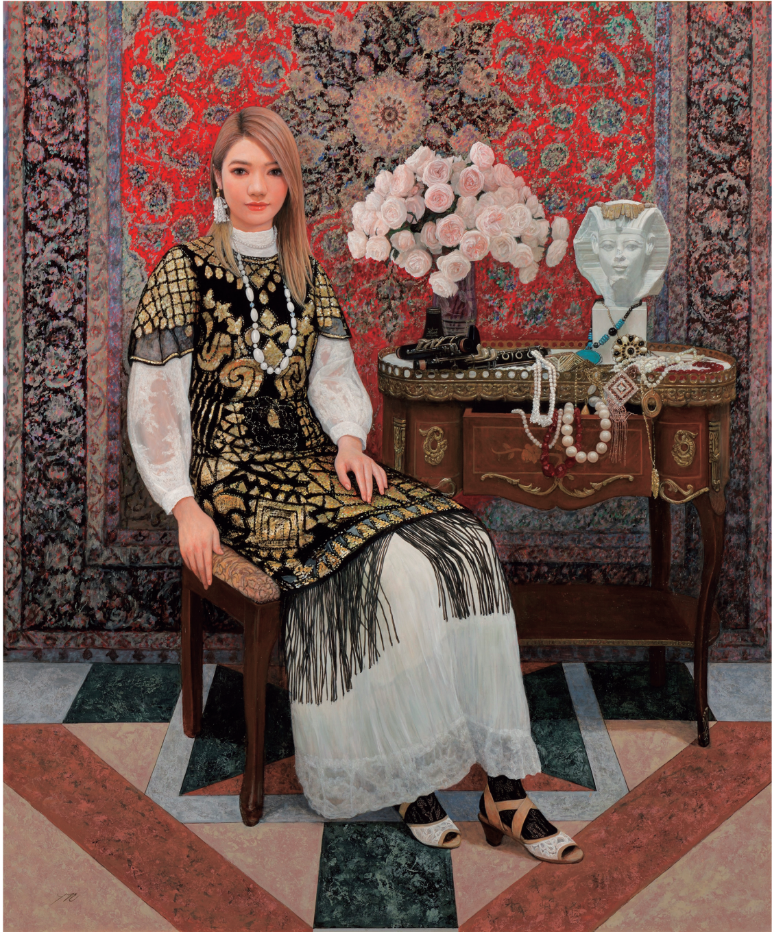
「民族衣装」 F130号 194×162センチ 油彩・キャンバス 2022年作 第108回 光風会展