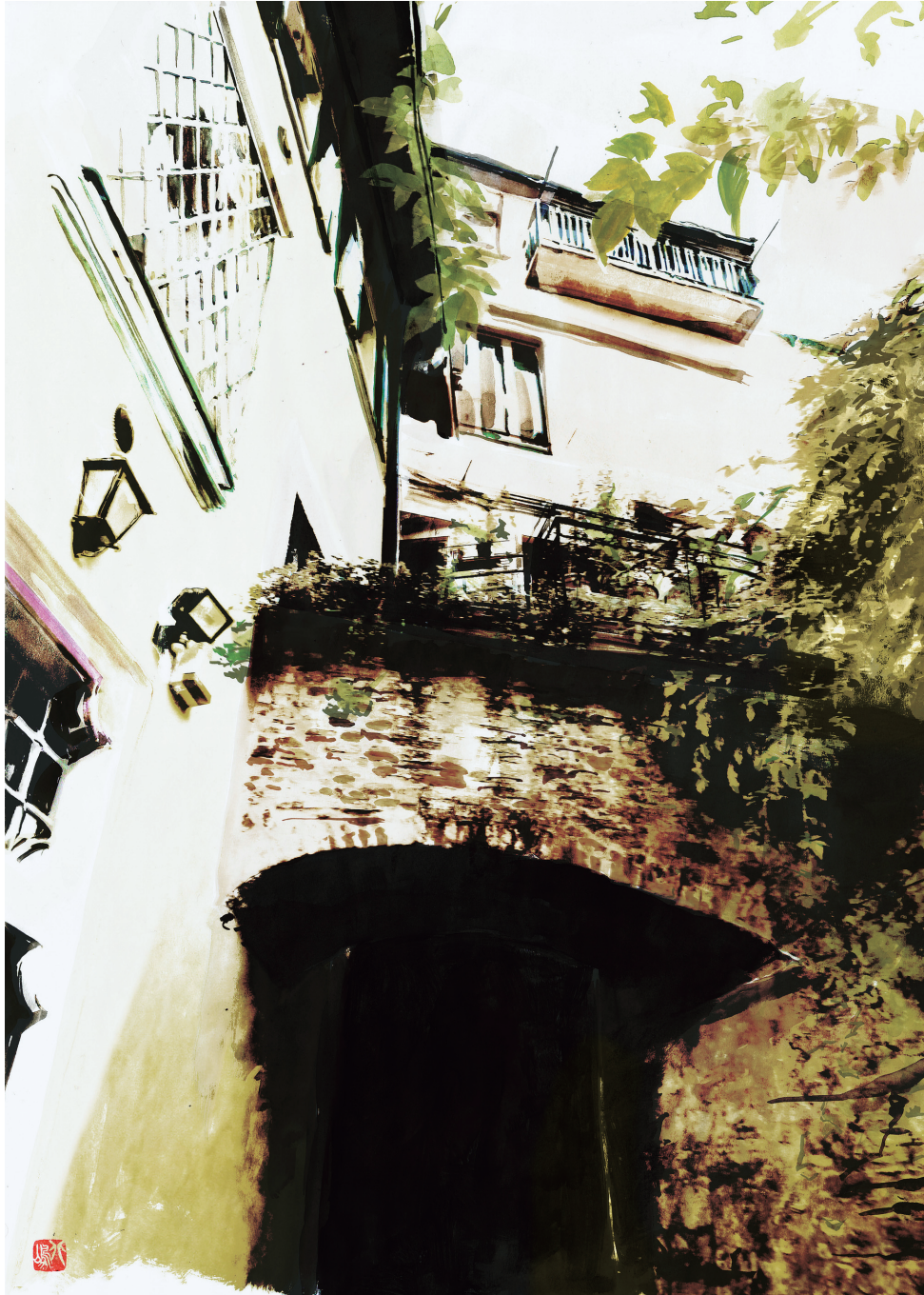
“Passeggia per le strade di Bergamo” 観光ガイドのためのイラストレーション アクリルガッシュ（水彩紙）による原画をClipStudioにて加筆・修正。サイズ：4335 pixels×6083 pixels