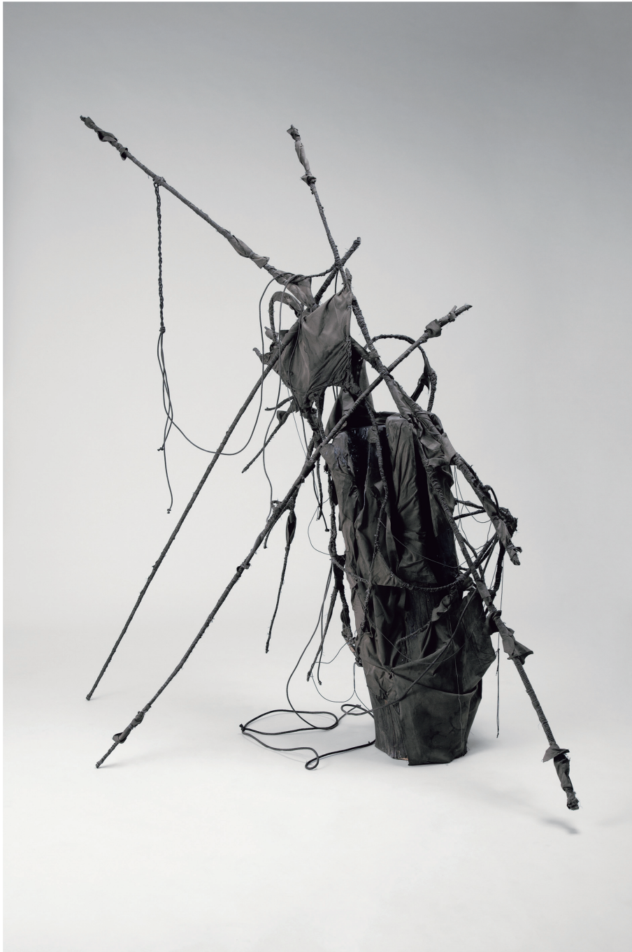
「相依性」 Interdependence 1800/600/800(mm) サイズ可変 木, 竹, 針金, 布に着彩