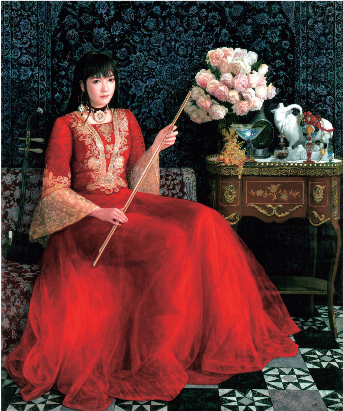
「演奏の後」 F130号 194×162センチ 油彩・キャンバス 2022年作 第9回日展