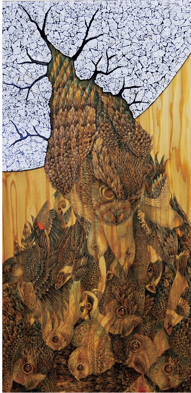
“eyes” 縦 90 cm 横 45 cm 漆芸, ボールペン, 水彩