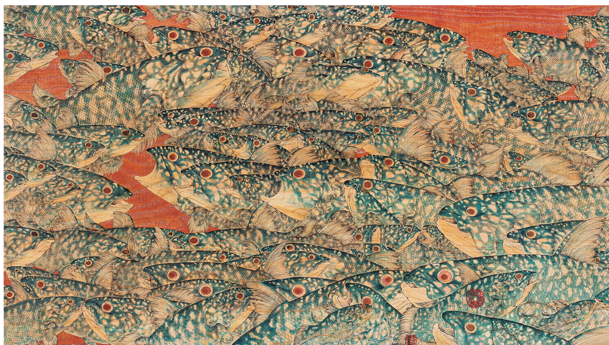
“SUBROSA” 縦 91 cm 横 162 cm ボールペン, 水彩