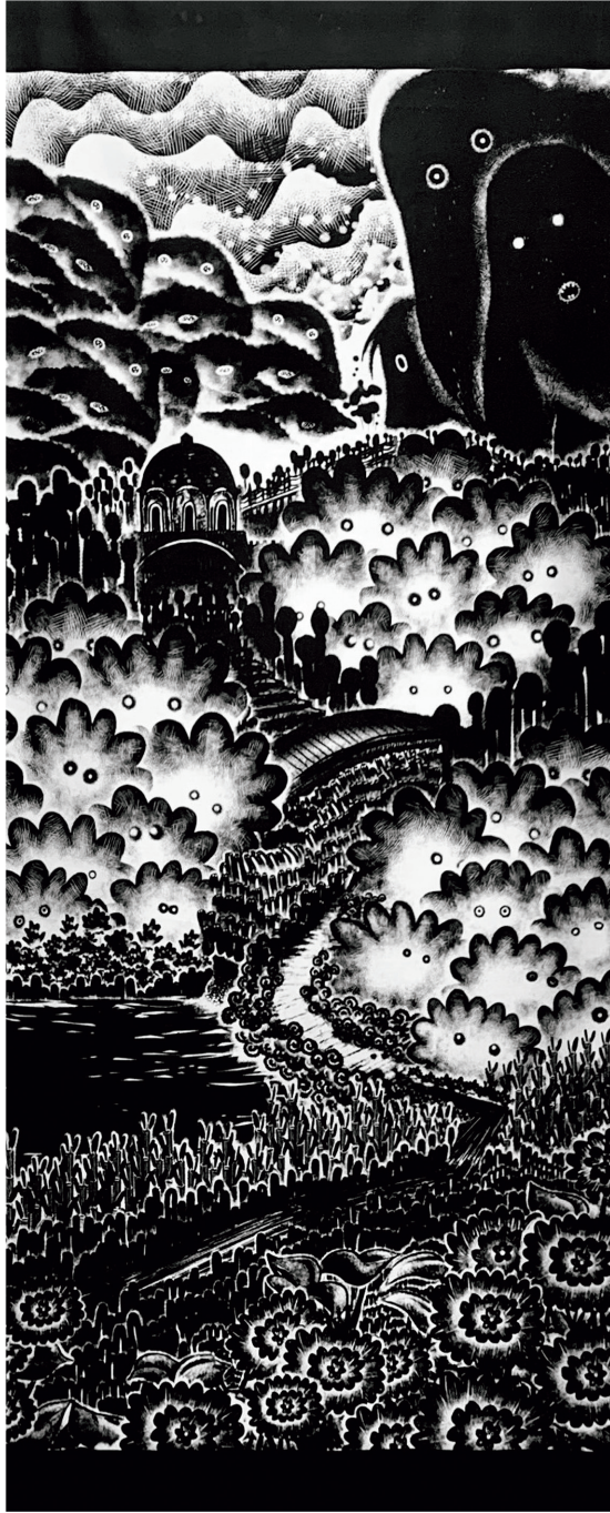
「どこもかしこも」 Everywhere H2500×W900 mm 綿/スクリーンプリント/顔料