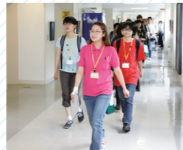
学科別キャンパスツアー