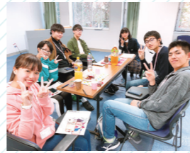
参加者同士お友達になったよ！