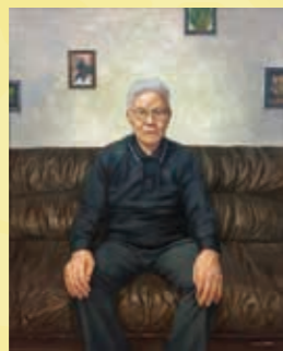
川村 未紗 (平成26年度卒) 「思い巡らす」 100F 油彩 カンヴァス 光風会 会員出品