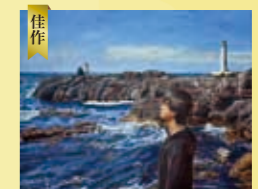
佳作 高橋 祐希 (3年) 「よみがえる想い」 30F エッグテンペラ 板