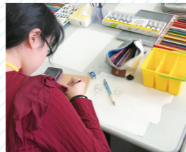
学科別プログラム(模擬授業)