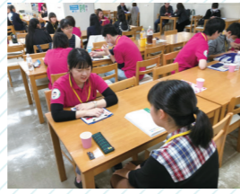
先生や学生スタッフとのフリートーク