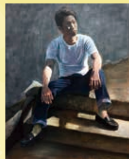
高田 健広 (平成21年度卒) 「日を浴びて」 100F 油彩 カンヴァス 光風会 会員出品