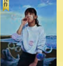
佳作 小林 美月 (4年) 「泡沫」 30F エッグテンペラ 板