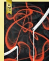
入選 國井 玲里 (3年) 「流(りゅう)」 50F エッグテンペラ 板