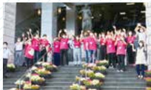
最後はみなさんをお見送り