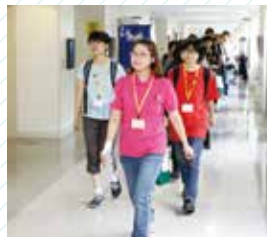
学科別キャンパスツアー