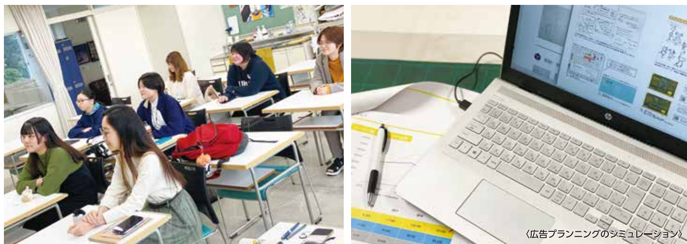
〈広告プランニングのシミュレーション〉

本ゼミでは「デザインは私的なモノではなく公的なモノである」という考え方を基本とし、デザインの現場に近くあることを常に心がけています。協力関係にある企業からはもちろん、様々なクライアントから実際にデザイン制作の依頼を受けることも多くあります。よって、社会の厳しい評価に直面し心が折れそうになることもあると聞きますが、その代わりに実践に役立つ経験を確実に重ねることが出来ます。