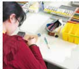
学科別プログラム(模擬授業)