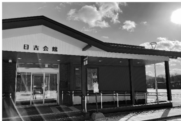
写真5 北見市日吉地区複合施設外観