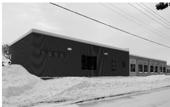
写真10 増築部分外観