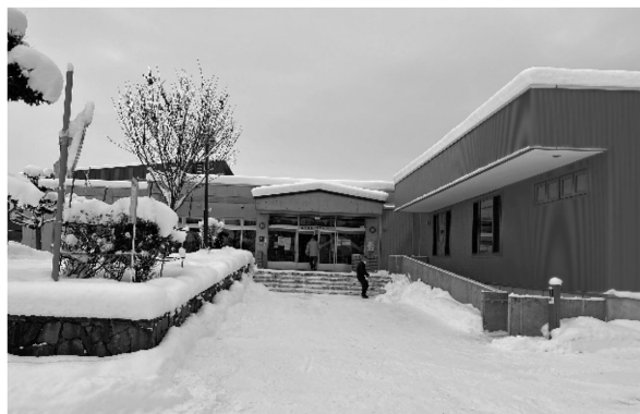
写真9 旭川市西神楽市民交流センター外観