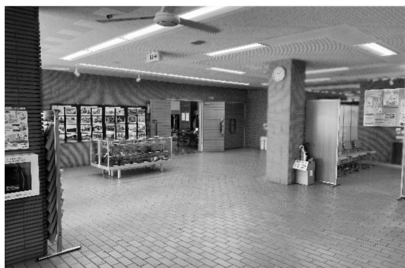
写真11 エントランスホール