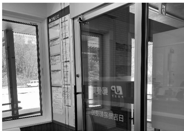
写真6 日吉簡易郵便局