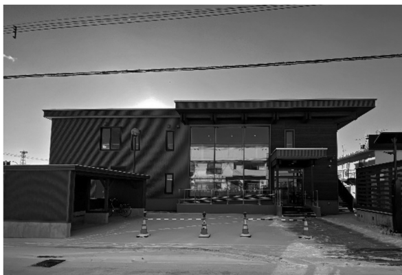
写真1 北見市西部地区公民館外観