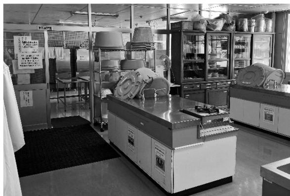
写真12 調理室・食品加工室

北見市は2事例とも新築事例であるが、地域の持つ課題に対し、エリアマネジメントの考え方を取り入れ、住民、行政が主体的に活動し、住民と事業主である行政、指定管理者が施設計画を含めた事業に積極的に関わっていることが明らかになった。