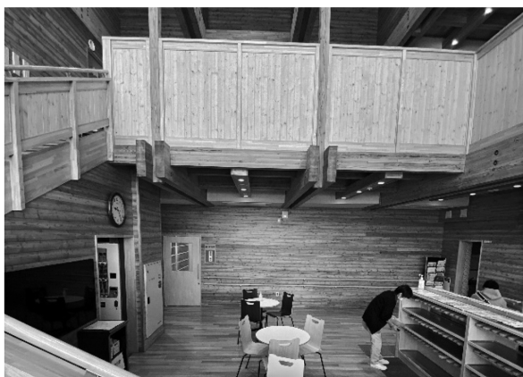
写真3 エントランスホール